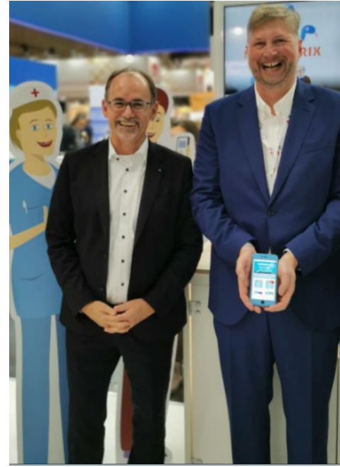
Politischer Besuch am 1. Messttag