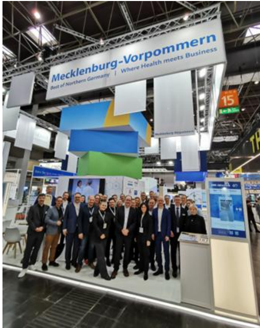
Unternehmen aus MV