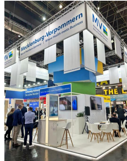
Offener und heller Messestand