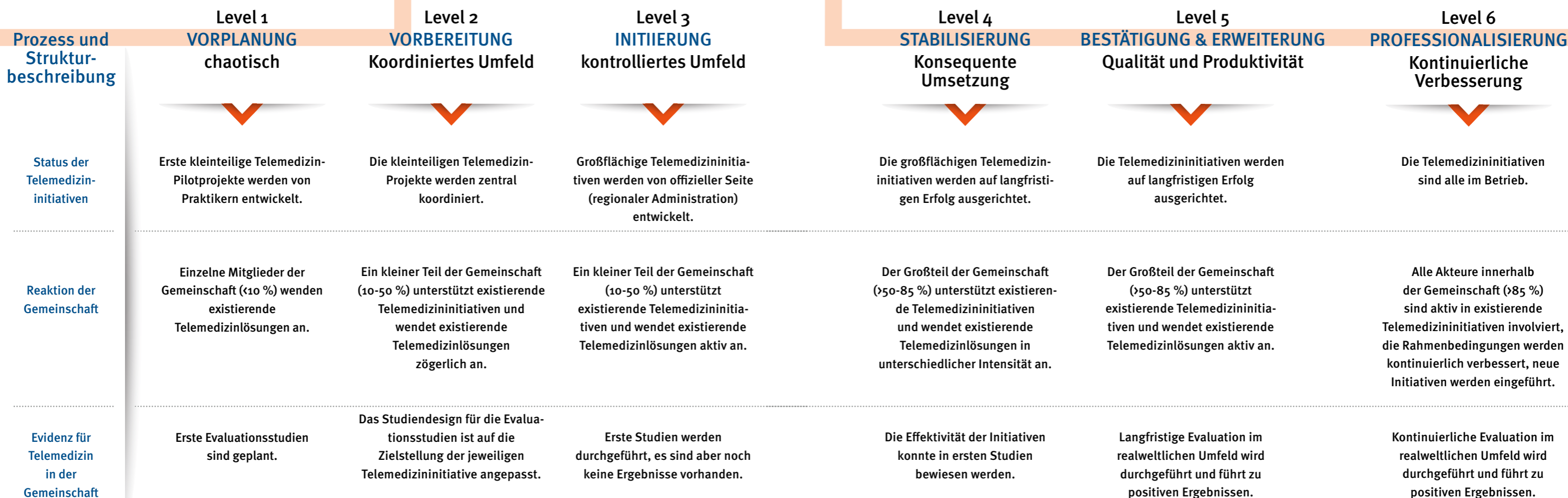
Abbildung 5: Telemedicine Community Readiness Modell (TCRM) 73

Pilotprojekte sowie eine strategische Weiterentwicklung und auch die Fokussierung auf ein Umsetzungsmanagement notwendig. Durch den Aufbau einer landesweiten Plattform sollen Digitale Gesundheitsanwendungen und -dienstleistungen in die Fläche gebracht werden. Vorschlägen für die strategische Umsetzung wird das Reifegradmodell für Telemedizin in Gemeinschaften (Telemedicine Community Readiness Modell (TCRM); vgl. Abbildung 5) 72 der Technischen Universität Dresden. Die hier zu errichtende Plattform ist primär als eine Koordinationsplattform und nicht als eine technische Plattform zu verstehen. Unterschiedliche technische Plattformen können wiederum Bestandteil der Koordinationsplattform sein.